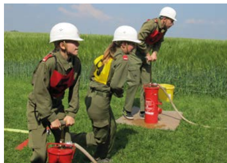
Unsere Jugendgruppe gibt Vollgas

Bronze Rang 124 (von 309 angetretenen Gruppen) und Silber Rang 207 (von 289 angetretenen Gruppen)