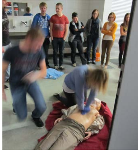
Voller Einsatz bei der Abschlussübung des Erste Hilfe Kurses

Friedenslicht: Alle Jahre wieder am 24. Dezember konnte das Friedenslicht in Feuerwehrhaus abgeholt werden. Die Feuerwehrjugend freute sich über den zahlreichen Besuch. Die Gäste konnten sich bei Glühwein und Keksen und einem Gespräch mit Freunden und Bekannten die Zeit bis zum Christkind etwas verkürzen.