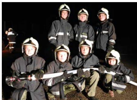
Jugendgruppe im Löscheinsatz

Nach diesem besonderen Erlebnis ging es zurück ins Feuerwehrhaus, wo zur Stärkung gegrillt und das Nachtlager vorbereitet wurde. Um ca. 22.00 Uhr hieß es dann „Brandalarm“. Ein Palettenstapel am Sportplatzgelände hatte