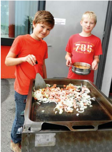
Grillen beim Jugendabschluss

Feuer gefangen. Die Jugendlichen wurden mit Einsatzbekleidung ausgerüstet und fuhren gemeinsam mit aktiven Mitgliedern zum Brand aus. Bei dieser Übung „erlebten“ die Jugendlichen einen Einsatz von der Alarmierung bis zum Reinigen der Geräte mit.