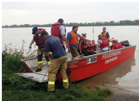
Bootsfahrt der Feuerwehrjugend auf dem Inn

Zum Abschluss des „Bewerbsjahres des Feuerwehrjugend“ stand Ende Juli noch das 6-Bezirkjugendlager auf dem Programm. Sieben Jugendliche und ihre Betreuerin verbrachten vier schöne Tage in Gschwand bei Gmunden,