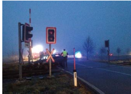
Verkehrsunfall Bahnübergang Geinberg

In Summe wurden für diese 39 Einsätze (Brände, technische Einsätze und Fehlalarme) über 450 Stunden von 354 Mann aufgewendet.