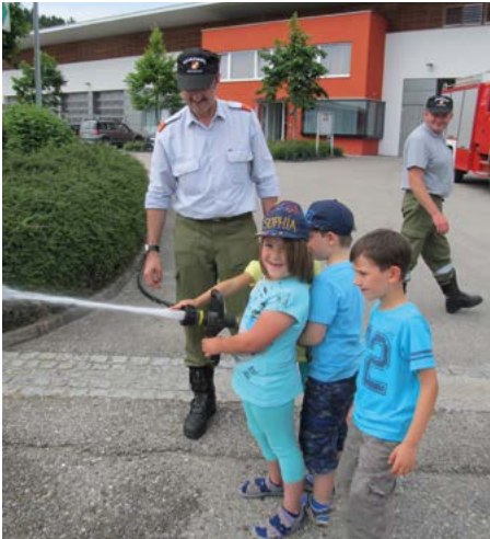
Erste Lösversuche der Kindergartenkinder

Ortsäuberungsaktion: Die alle zwei Jahr stattfindende Ortssäuberungsaktion fand auch durch die FF Geinberg Unterstützung und somit wurde ein kleiner Beitrag für ein sauberes Geinberg geleistet.