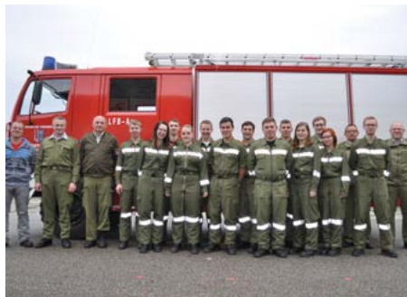
Die Teilnehmer aus Geinberg und Moosham mit Bewerter

genaue Kennenlernen der Geräte und Fahrzeuge der anderen Feuerwehr gelegt. Dies ist in der heutigen Zeit sehr wichtig, weil viele Mitglieder tagsüber beruflich bedingt für Einsätze nicht zu Verfügung stehen und somit die Zusammenarbeit von mehreren Feuerwehren notwendig ist.