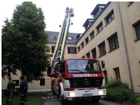
Übung Schloss Neuhaus