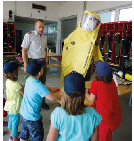
Großes Interesse bei der Vorführung des Vollschutzanzuges