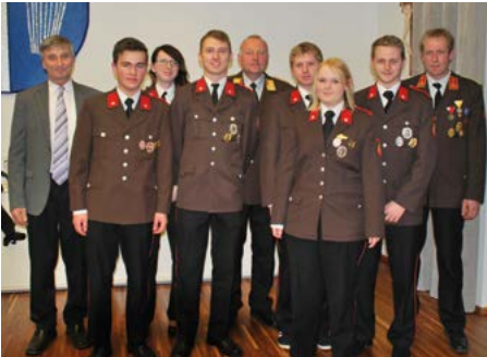
Verleihung Leistungsabzeichen für Bewerbungsgruppe