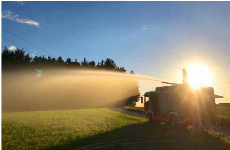
Übung Wasserförderung Wintebauerberg | 7. Juni