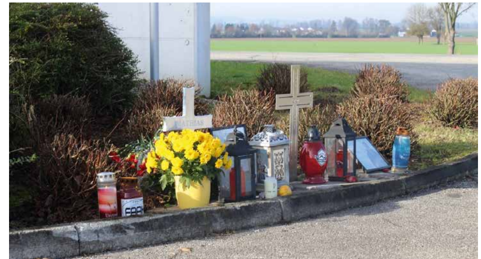
Schwerer Verkehrsunfall vor dem Feuerwehrhaus | 15. April