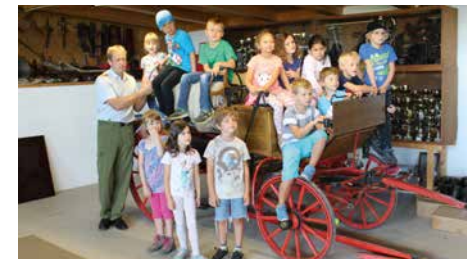
Der Kindergarten zu Besuch bei der Feuerwehr | 30. Juni