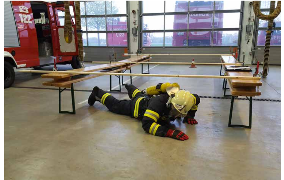
Leistungstest für Atemschutzträger („Finnentest“) | 22. September