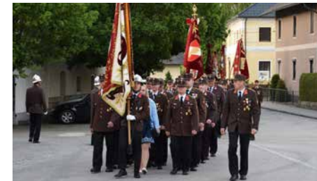
Feuerwehrfest St. Georgen | 26. Mai