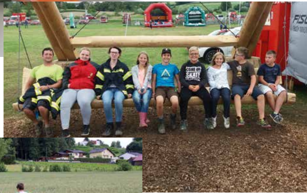
Jugendlager St. Georgen im Attergau Juli