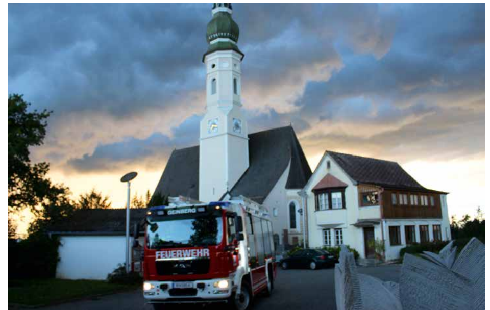
Übung im Dechanthaus am Kirchenplatz | 06. September