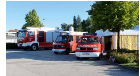
Tag der offenen Tür | 13. August