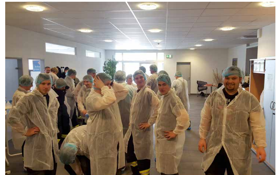
Frühjahrsübung Firma Berglandmilch | 04. April