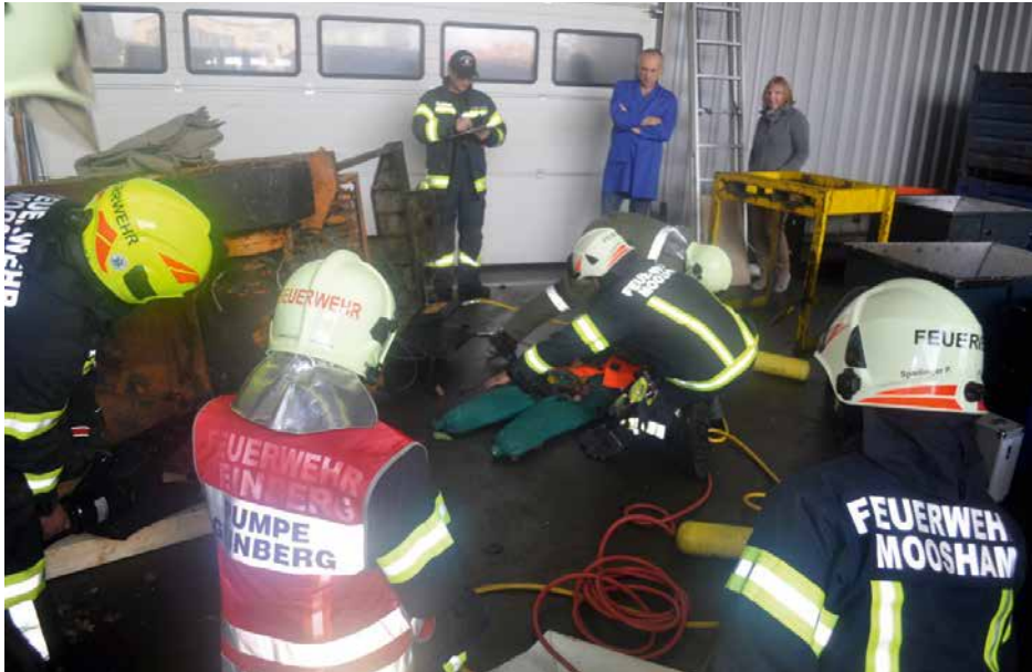
Herbstübung Firma KOWE | 21. Oktober